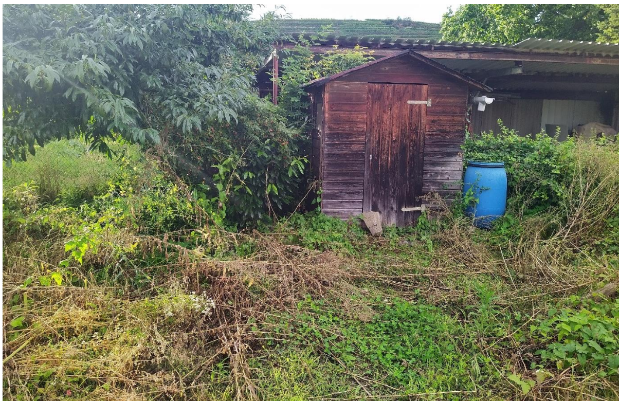
Abb. 3: Eine der beiden Gartenhütten. Der im Hintergrund zu sehende Schopf steht außerhalb des Plangebietes.