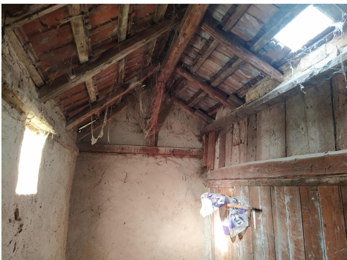
Abb. 4: In diesem Gartenschuppen konnte einmalig Fledermauskot festgestellt werden.