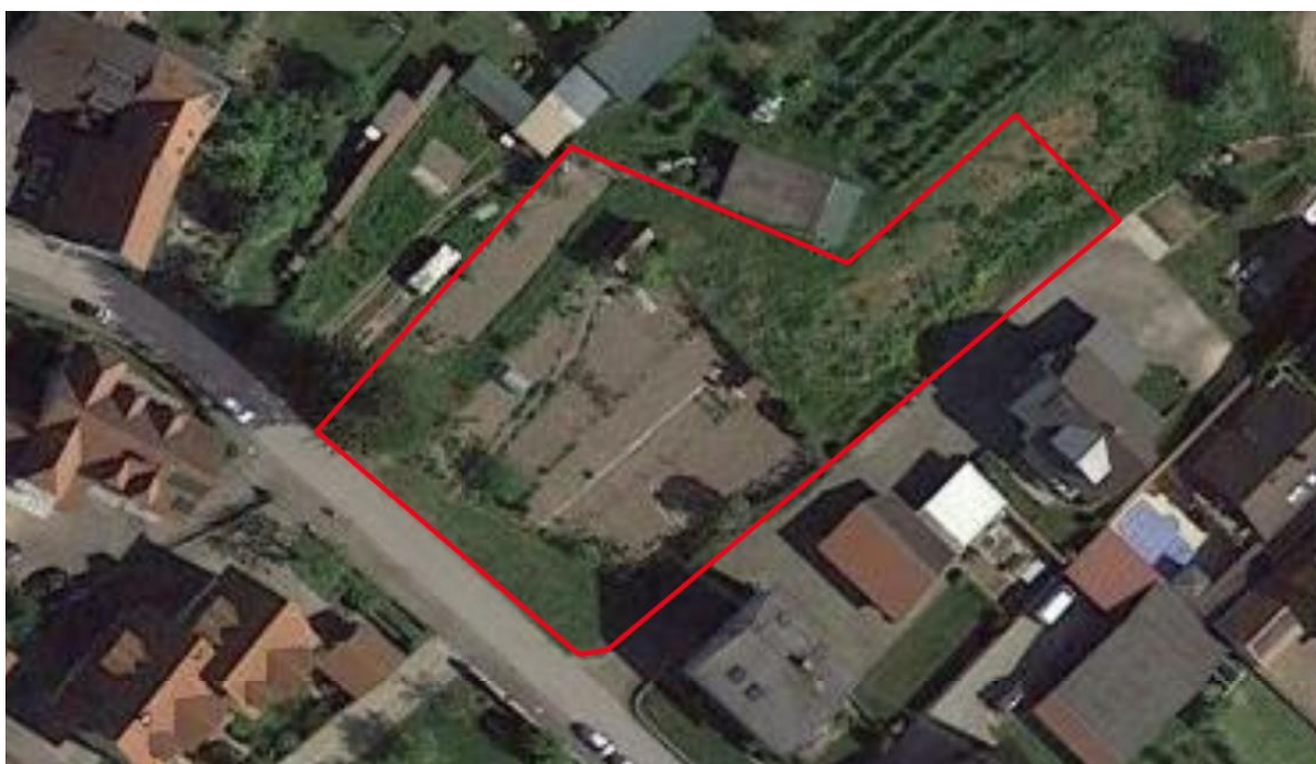
Abb. 6: Luftbild des Plangebiets mit Gemüsegärten und angrenzender Siedlung.

Im Südwesten und Südosten grenzt ein Wohngebiet bzw. eine Straße unmittelbar an das Plangebiet.