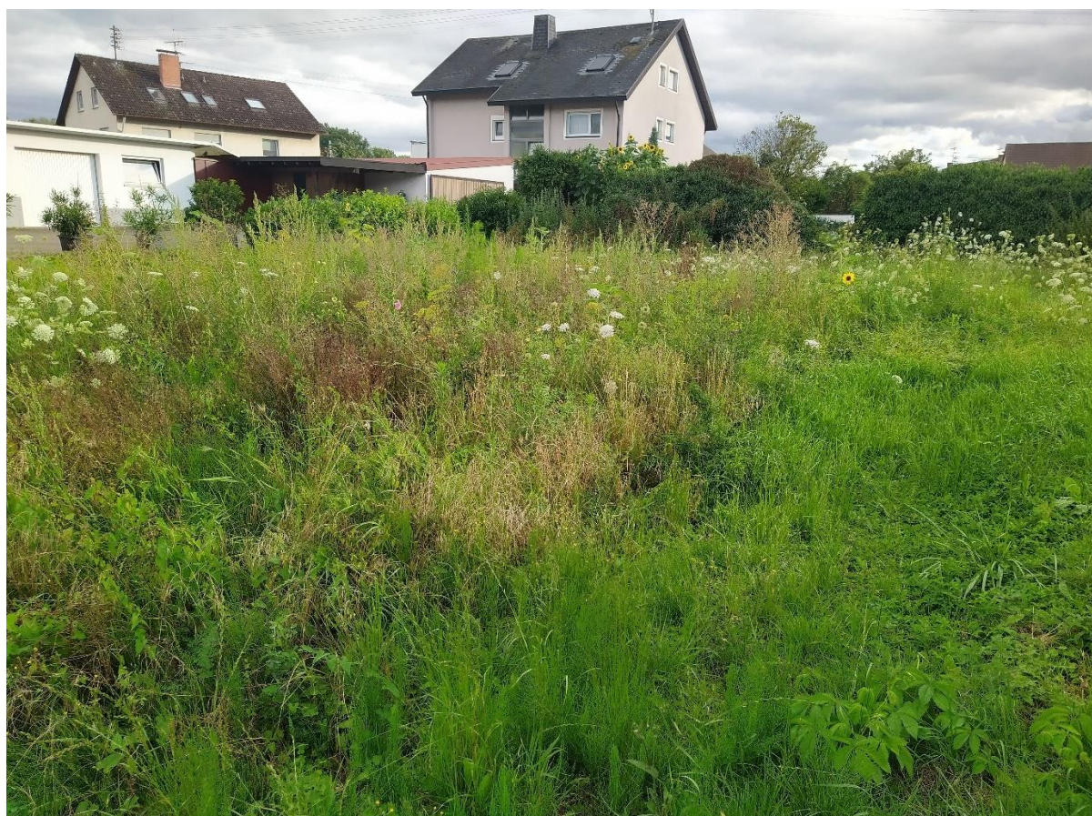
Abb. 2: Im Vordergrund: Grasreiche ausdauernde Ruderalvegetation. Im Hintergrund: Efeu-Fichten-Hecke.

Schutzstatus nach Vogelschutzrichtlinie (VSchRL) (79/409/EWG): Anhang I (“in Schutzgebieten zu schützende Vogelarten”), Z = Zugvogelart nach Art 4, Abs. 2, für die in BaWü Schutzgebiete ausgewiesen wurden. Alle wildlebenden europäischen Vogelarten stehen nach Artikel 1 der VSchRL unter besonderem Schutz.