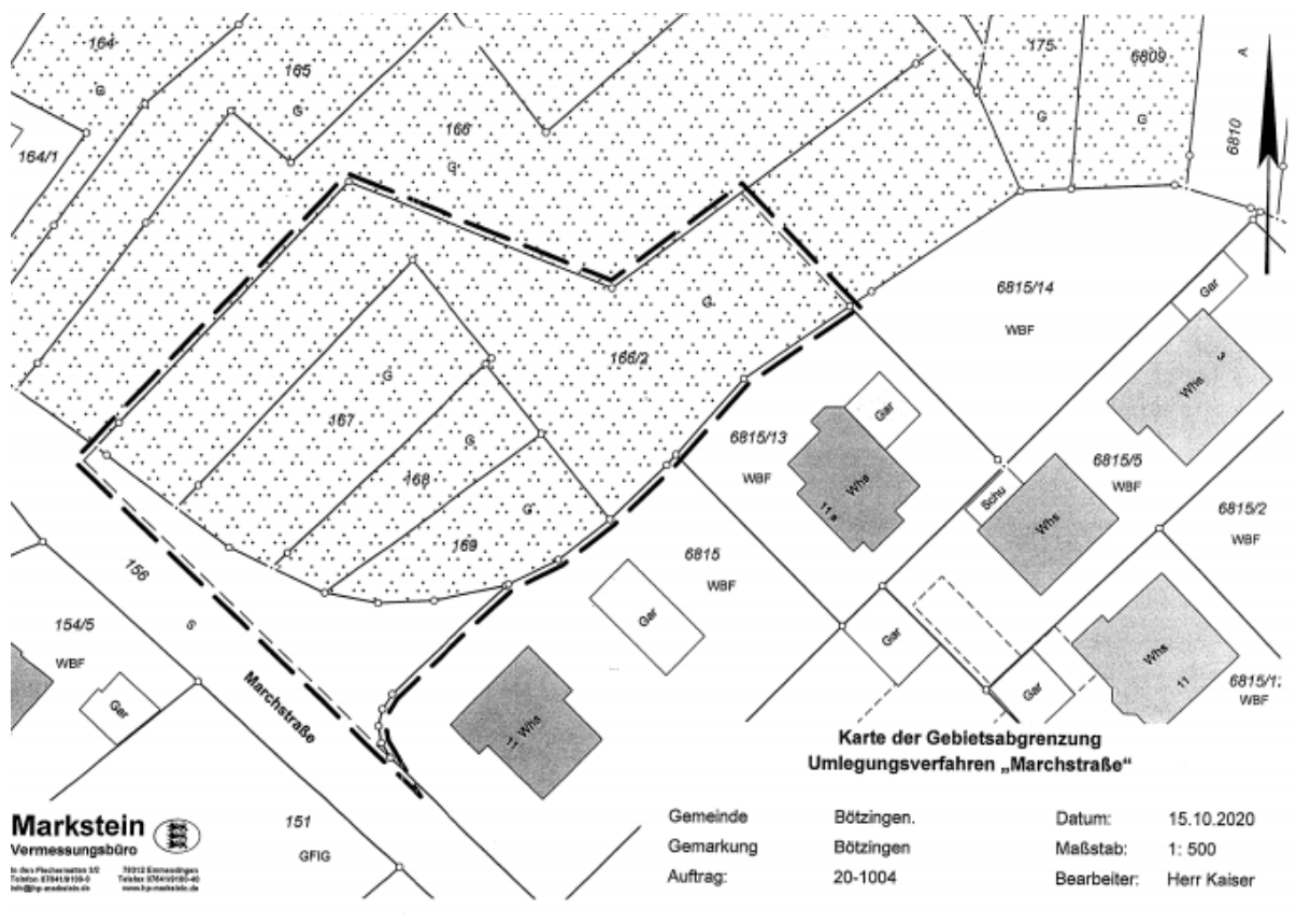
Abb. 1: Gebietsabgrenzung des Plangebiets „Marchstraße II“ (gestrichelte Linie).

Im Zuge der Aufstellung des Bebauungsplans ist ein Umweltbericht mit artenschutzrechtlicher Prüfung zu erstellen.